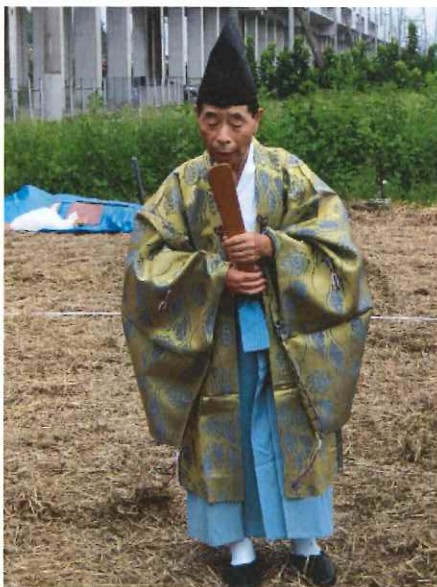
笏（しゃく）と烏帽子