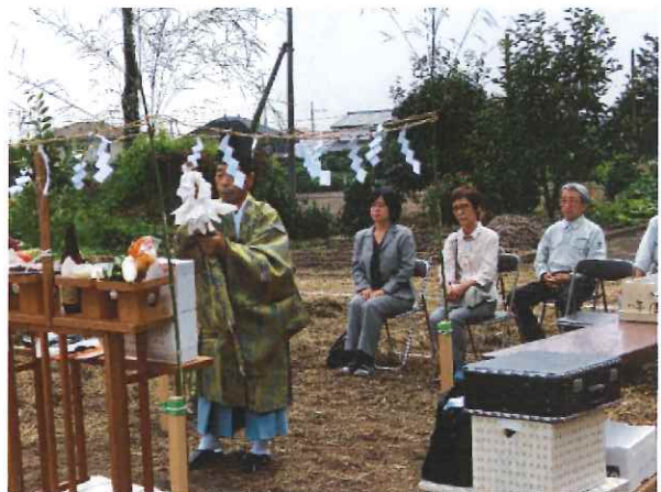
祝詞をあげています