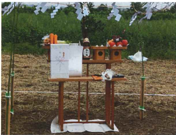
理事長が用意してくださった祭壇